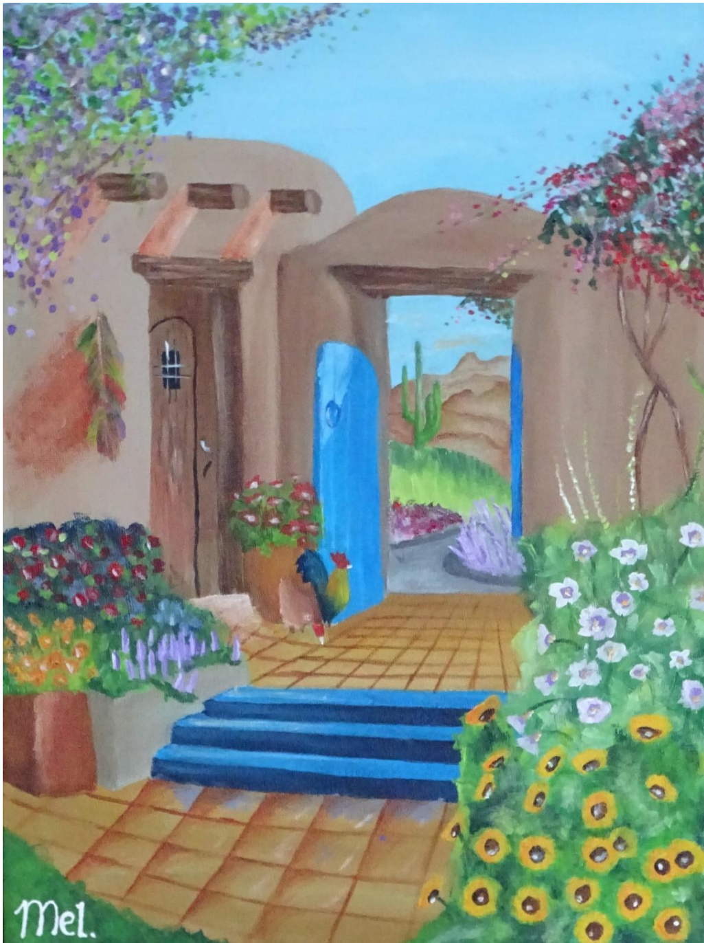
Doorkijkje in Mexico