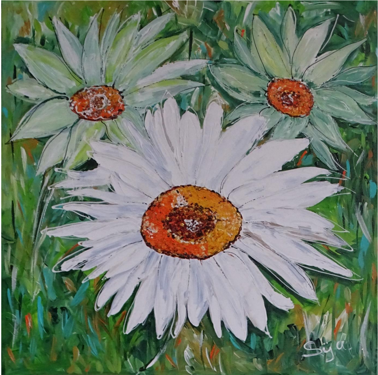
Sprankelende witte bloem