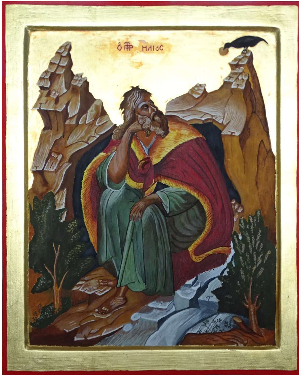
Profet Elia bij de beek Krith