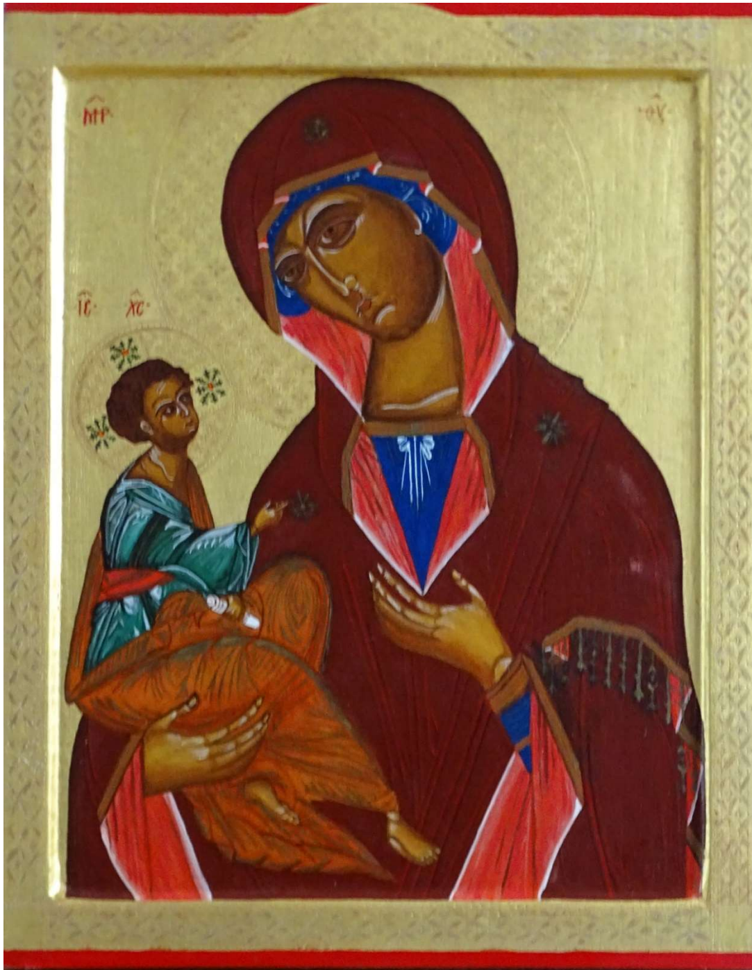
Moeder Gods Jerusalimskaja Jeruzalem/Rusland, 15 e eeuw 25 x 34 cm

De oer icoon, die het werk van de evangelist Lucas zou zijn geweest, kwam in