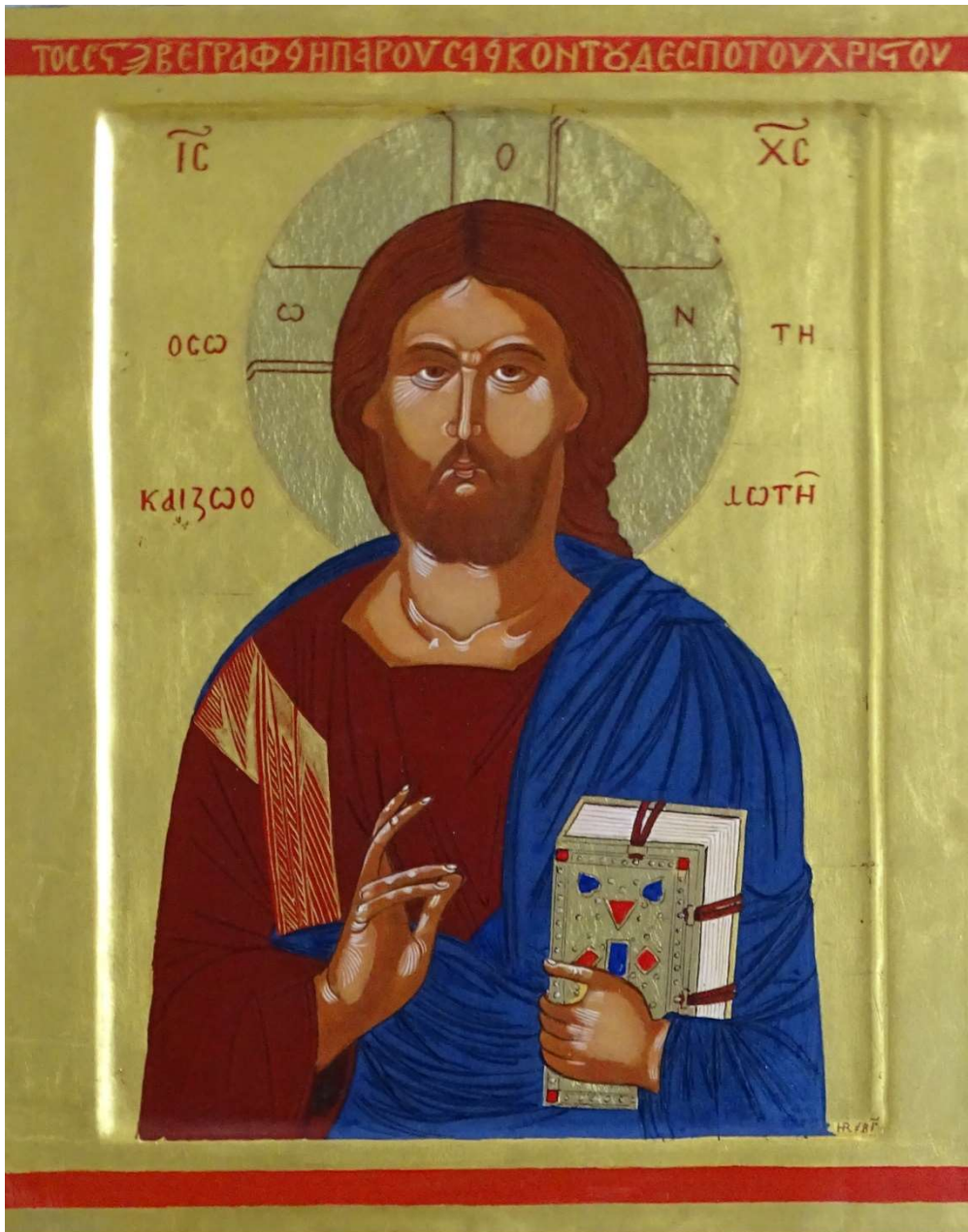
Christus Pantokrator Macedonië, 14 e eeuw 31 x 44 cm

Christus de Verlosser en Levensschenker. Een icoon van Christus in half formaat, rechts met de zegenende hand en links met een prachtig evangelieboek. De tekst in de icoonrand luidt: "De icoon van onze Heer Jezus Christus is geschilderd in het jaar 1393 – 1394"