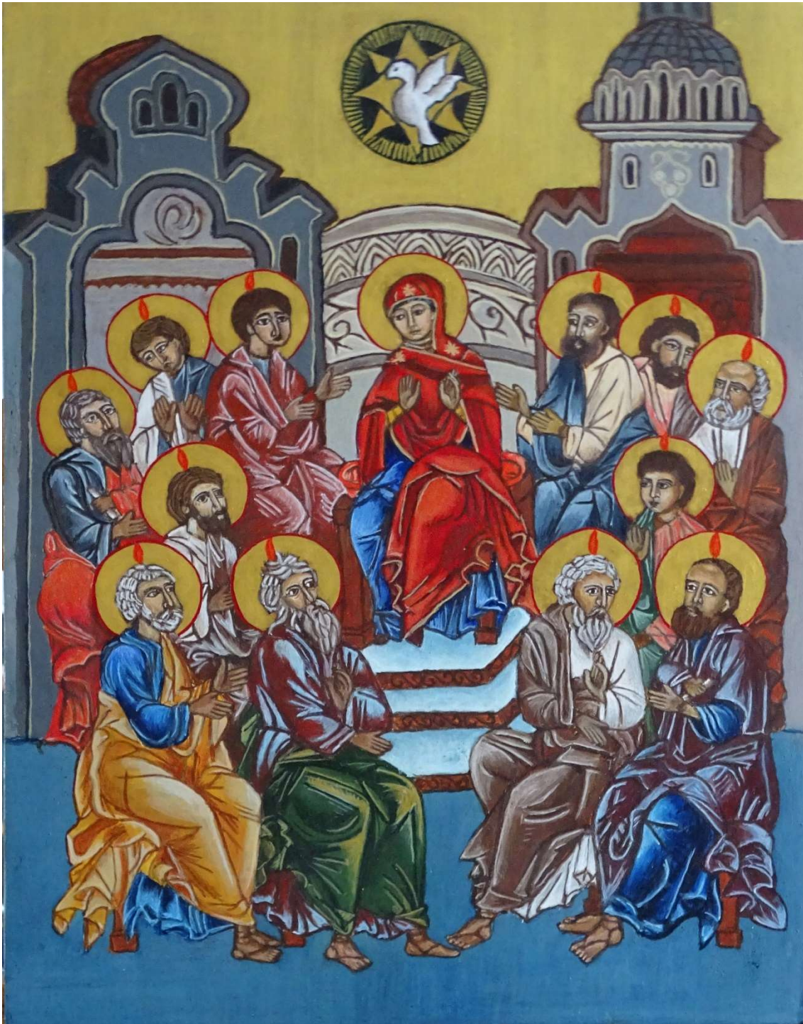
Pentekoste – Pinksteren 30 x 40 cm

Deze icoon van Pinksteren toont Maria de Moeder van God in het midden, op de “Lerarenstoel”.