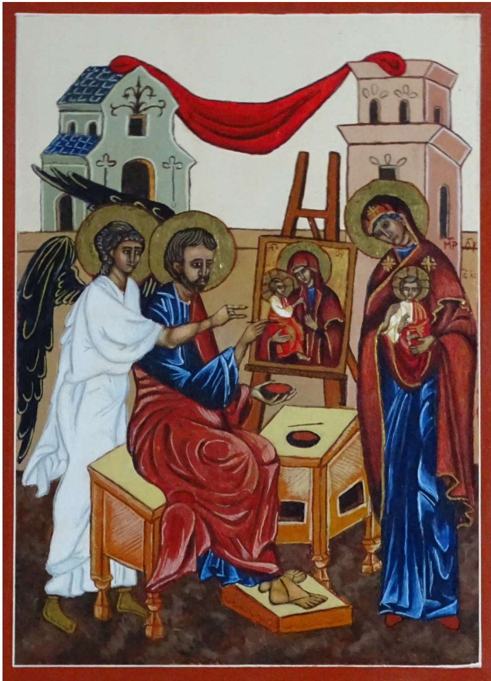
Evangelist en arts Lukas, beschermheilige van de kunstenaars