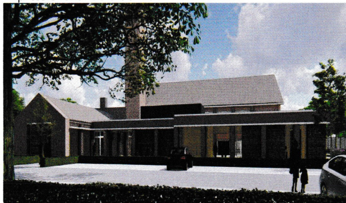
Impressie vanaf de Hugo de Grootlaan