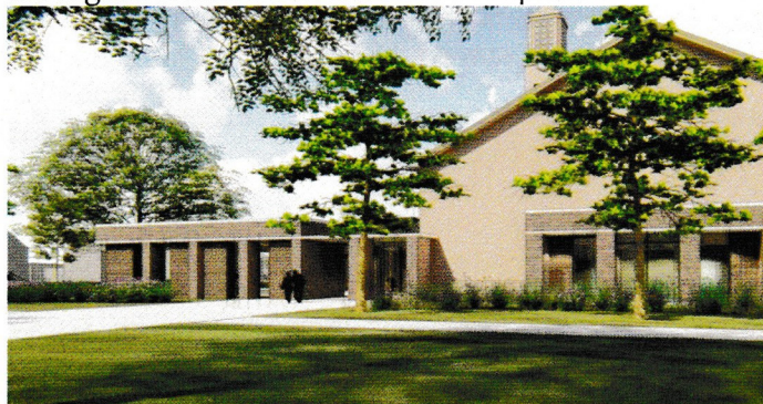
Impressie vanaf de Groen van Prinstererlaan

Kortom een ruimte die we goed kunnen gebruiken en moet gaan bruisen. Ook hiervan een impressie.