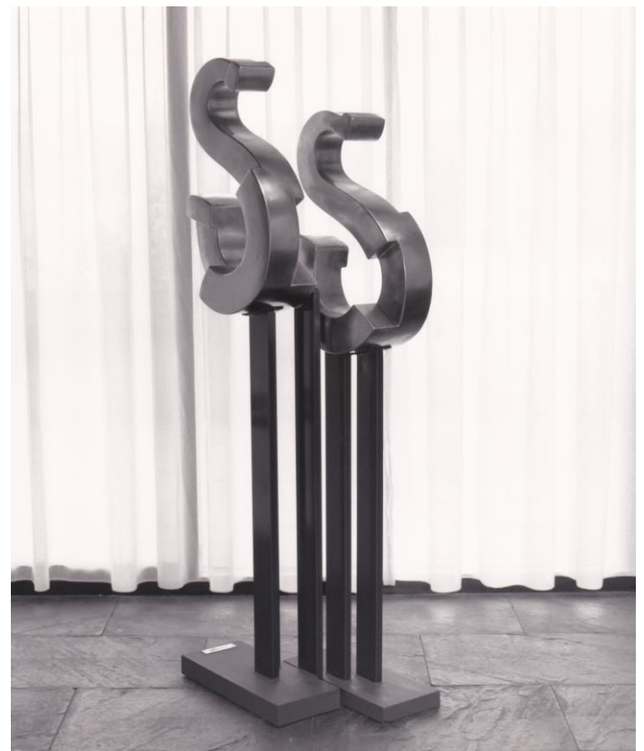
Corroborat in Deo (1987). Materiaal: roestvast staal. Afmetingen: hoog 1.65 mtr., omvang 0.50 mtr.

Het thema Kerk + Kunst is niet meer weg te denken uit onze Protestantse gemeente. Ook bij de vernieuwbouw willen we hier aandacht aan schenken o.a. door de mogelijkheid te bieden om te exposeren. In nieuwsbrief 4 lieten we al één van de 6 beelden zien van kunstenaar Bert Pulles, die onze kerk voor onbepaalde tijd ter leen heeft ontvangen. Deze editie de beschrijving van een tweede beeld met toelichting van Bert Pulles.