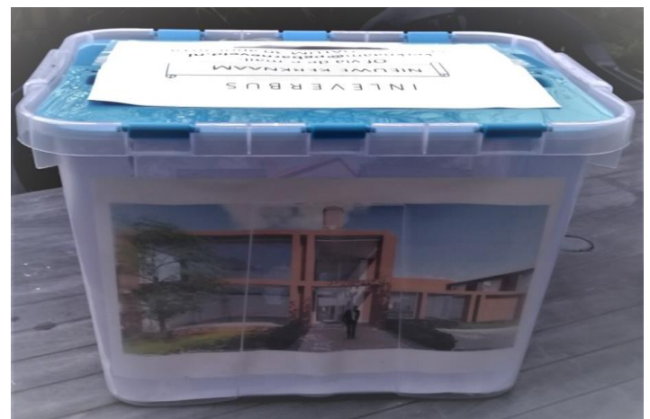
Impressie: ingang aan de Hugo de Grootlaan

Namen mogen met toelichting gestuurd worden naar kerknaam@pgbarneveld.nl , of ingeleverd worden in de namenbus, die in beide kerken in de hal staat. Graag uw naam en toelichting vermelden.